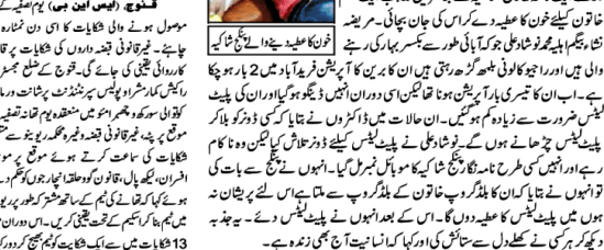
میں ہونٹی کے خلاف کارروائی کی گئی۔