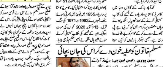
میں ہونٹی کے خلاف کارروائی کی گئی۔