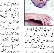
ادھوٹھا کر نہیں ہوں گے مہا واکس اگھاڑی کے وزیر اعلیٰ کا چہرہ