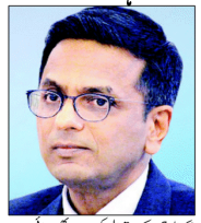
چیف جسٹس چندر چوڈا کی تصویر

ہر ہندوستانی کو اپنی مرضی کے مطابق جینے کا حق ہے، چیف جسٹس چندر چوڈا کو لاکا تا میں سمینار سے خطاب