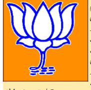
بی جے پی کا لوگو

پارٹی کے قومی صدر کا بھی اسی سال ہوگا انتخاب