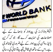
ورلڈ بینک کا لوگو

ورلڈ بینک کے کاربن اور توانائی کی ترقی کیلئے 1.5 ارب ڈالر