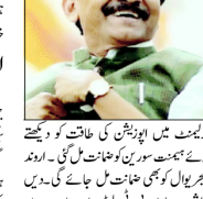
ملک کو ایسے لیڈر کی ضرورت ہے جو سب کو ساتھ لے کر چل سکے۔ راوت