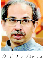
مہاراشٹر کے وزیر خزانہ اجیت چاورے

مہاراشٹر کے وزیر خزانہ اجیت چاورے نے کہا کہ بجٹ میں ترقیاتی کاموں کو ترجیح دی جائے گی۔ ان کی تقریب کے دوران مہاراشٹر کے وزیر خزانہ اجیت چاورے نے کہا کہ بجٹ میں ترقیاتی کاموں کو ترجیح دی جائے گی۔