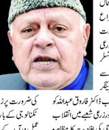
فاسٹی سٹریٹ پر مقابلہ کیلئے کھٹیا کی شوگر کی کوئڈین بنانے کی ضرورت

فاسٹی سٹریٹ پر مقابلہ کیلئے کھٹیا کی شوگر کی کوئڈین بنانے کی ضرورت۔ فاسٹی سٹریٹ پر مقابلہ کیلئے کھٹیا کی شوگر کی کوئڈین بنانے کی ضرورت۔