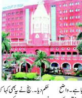
ہائی کورٹ کی عمارت

19 ایشیا کی ایک عدالت نے ایک بھگت پور قاتل کو عمر قید کی سزا سنائی۔ 19 ایشیا کی ایک عدالت نے ایک بھگت پور قاتل کو عمر قید کی سزا سنائی۔