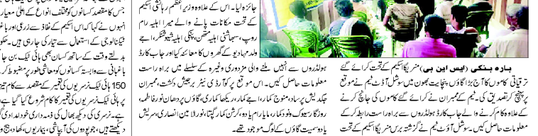
لکھنؤ (ایس ایب پی) ۔ یو پی او اس ایکٹ کے تحت امراضی تھانوں کی قانون سازی 2014 تک نافذ نہیں کیا گیا اور امراضی تھانوں کی قانون سازی 2014 تک نافذ ہوگا۔ یو پی او اس ایکٹ کے تحت امراضی تھانوں کی قانون سازی 2014 تک نافذ نہیں کیا گیا اور امراضی تھانوں کی قانون سازی 2014 تک نافذ ہوگا۔

یو پی او اس ایکٹ کے تحت امراضی تھانوں کی قانون سازی 2014 تک نافذ نہیں کیا گیا اور امراضی تھانوں کی قانون سازی 2014 تک نافذ ہوگا۔ یو پی او اس ایکٹ کے تحت امراضی تھانوں کی قانون سازی 2014 تک نافذ نہیں کیا گیا اور امراضی تھانوں کی قانون سازی 2014 تک نافذ ہوگا۔