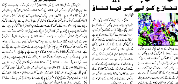
گود کمپون (ایس ایب پی) ۔ گاؤں میں پہنچی پولیس، لوگوں سے کی بات - چیت۔ گاؤں میں پہنچی پولیس، لوگوں سے کی بات - چیت۔ گاؤں میں پہنچی پولیس، لوگوں سے کی بات - چیت۔