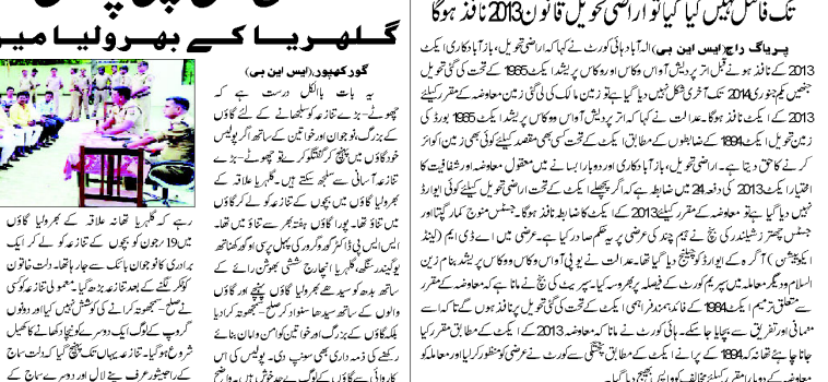
پولیس (ایس ایب پی) ۔ یو پی او اس ایکٹ کے تحت امراضی تھانوں کی قانون سازی 2014 تک نافذ نہیں کیا گیا اور امراضی تھانوں کی قانون سازی 2014 تک نافذ ہوگا۔ یو پی او اس ایکٹ کے تحت امراضی تھانوں کی قانون سازی 2014 تک نافذ نہیں کیا گیا اور امراضی تھانوں کی قانون سازی 2014 تک نافذ ہوگا۔