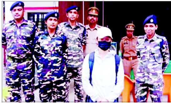
موجا گنج (ایس ایب پی) سیکوریٹی اہلکاروں نے چینی خاتون کو گرفتار کیا ہے جو ہندوستان میں غیر قانونی طور پر ہجرت کرنے والی تھی۔ پولیس نے خاتون کو گرفتار کیا ہے۔ پولیس نے خاتون کو گرفتار کیا ہے۔ پولیس نے خاتون کو گرفتار کیا ہے۔

دہلی، ہندوستان۔ ایک چینی خاتون نے غیر قانونی طور پر ہندوستان میں داخلہ لینے کی کوشش کی تھی، جس کے لیے اسے گرفتار کیا گیا۔ پولیس نے خاتون کو گرفتار کیا ہے۔ پولیس نے خاتون کو گرفتار کیا ہے۔ پولیس نے خاتون کو گرفتار کیا ہے۔