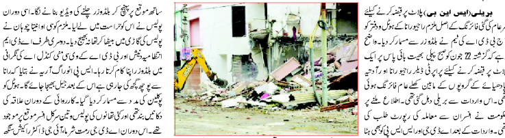
پولیس (ایس ایب پی) ۔ ملزم گرفتار، وزیر اعلیٰ کی زیر نگرانی کا نکھار اٹھ گئی تھانوں کی فورس اور دفتر کو مسمار۔ ملزم گرفتار، وزیر اعلیٰ کی زیر نگرانی کا نکھار اٹھ گئی تھانوں کی فورس اور دفتر کو مسمار۔ ملزم گرفتار، وزیر اعلیٰ کی زیر نگرانی کا نکھار اٹھ گئی تھانوں کی فورس اور دفتر کو مسمار۔