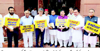
پارلیمنٹ کے باہر مظاہرہ کرنے والے لوگ

نئی دہلی (ایس این بی)۔ وزیر اعلیٰ اروند کجر نے پارلیمنٹ میں صدر کے خطاب کا بائیکاٹ کیا۔ انھوں نے کہا کہ انھیں پارلیمنٹ میں صدر کے خطاب کا بائیکاٹ کیا۔ انھوں نے کہا کہ انھیں پارلیمنٹ میں صدر کے خطاب کا بائیکاٹ کیا۔ اروند کجر نے کہا کہ انھیں پارلیمنٹ میں صدر کے خطاب کا بائیکاٹ کیا۔ انھوں نے کہا کہ انھیں پارلیمنٹ میں صدر کے خطاب کا بائیکاٹ کیا۔ انھوں نے کہا کہ انھیں پارلیمنٹ میں صدر کے خطاب کا بائیکاٹ کیا۔ اروند کجر نے کہا کہ انھیں پارلیمنٹ میں صدر کے خطاب کا بائیکاٹ کیا۔ انھوں نے کہا کہ انھیں پارلیمنٹ میں صدر کے خطاب کا بائیکاٹ کیا۔ انھوں نے کہا کہ انھیں پارلیمنٹ میں صدر کے خطاب کا بائیکاٹ کیا۔