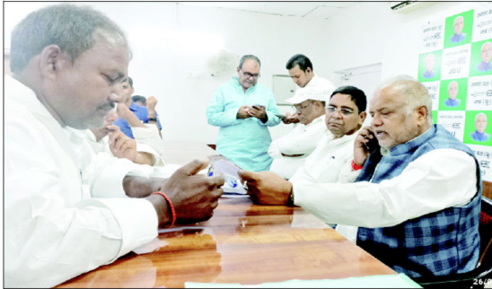
راچیورنگ ڈی یو پی دفتر میں منقرعہ گواہی ساعت پر گرام سے دو دیہی ترقیات محکمہ کے وزیران مارکا اظہار خیال

بھنبہ (ایس این پی) - پٹنہ کے نئے ڈی ایم کا عہدہ سنبھالنے کے بعد ڈاکٹر چندر شکھر سنگھ کی متعلقہ عہدیداران کے ساتھ میٹنگ میں اظہار خیال کیا۔