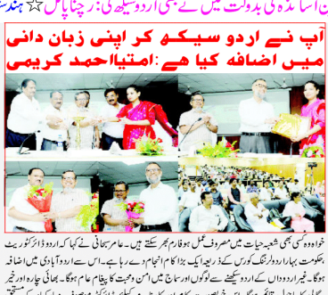
بھنبہ (ایس این پی) - بھندستان میں پیدا ہونے والی اردو میں بھارتی قوم: نبیشہ ڈراما