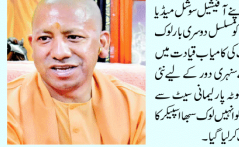
اوم برلا کی قیادت میں نئی بلندیاں حاصل کرے گا پارلیمنٹ کا وقار۔

اوم برلا کی قیادت میں نئی بلندیاں حاصل کرے گا پارلیمنٹ کا وقار۔ انہوں نے کہا کہ اوم برلا کی قیادت میں نئی بلندیاں حاصل کرے گا پارلیمنٹ کا وقار۔