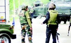
جسون کے تھوڑے تھوڑے گروہوں کے...