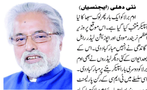
نشی دھلی (جینسیان) اوم برلا ایک بار پھر لوک سبھا میں اپوزیشن لیڈر بن گئے۔

نشی دھلی (جینسیان) نے اوم برلا کو دوسری بار ایوان کا اسپیکر بننے پر مبارکباد دی ہے۔ انہوں نے کہا کہ اس بار ملک کو اپوزیشن لیڈر ملنے میں خوشی ہے۔ انہوں نے کہا کہ اوم برلا ایک بار پھر لوک سبھا میں اپوزیشن لیڈر بن گئے۔ انہوں نے کہا کہ اس بار ملک کو اپوزیشن لیڈر ملنے میں خوشی ہے۔