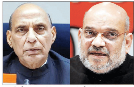
نئی دہلی (ایجنسیوں) 18 ویں کو سماج مخالف خاندان کی بی بی کے قیادت والی این ڈی ایس اور ایف ڈی این ایڈیٹری نے میڈیا کے سامنے اعلان کیا کہ ایمر جنسی ہندوستانی جمہوریت کے قتل کی سب سے بڑی مثال ہے۔

انہوں نے کہا کہ سبیل پر سفر شہر لگانے کی آہن میں ترمیم کی گئی اور عدلیہ پر بھی قدغن لگانے کی گئی، آئین کی ترمیم اور پھر ہی بی بی نے مرنے سے پہلے کہا کہ ایمر جنسی ہندوستان کے قانونوں اور اصولوں کے خلاف ہے، جمہوریت کے قتل کی سب سے بڑی مثال ہے۔ انہوں نے کہا کہ ایمر جنسی ہندوستان کے قانونوں اور اصولوں کے خلاف ہے، جمہوریت کے قتل کی سب سے بڑی مثال ہے۔