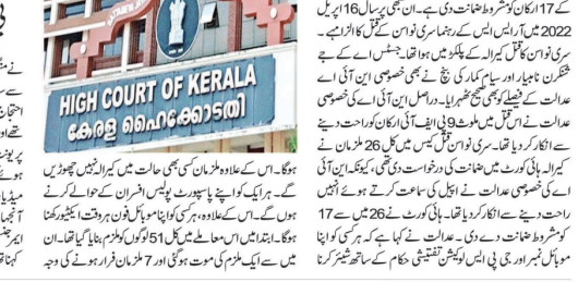
ہائی کورٹ آف کیرالا کی عدالت نے پانچ ڈفرنٹ انڈیا کے 17 ملزمان کو مشروط ضمانت دی ہے۔

پانچ ڈفرنٹ انڈیا (ایف ڈی آئی) کے 17 نامیہ ملزمان کو مشروط ضمانت دی ہے۔