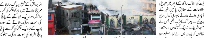
اوہی منزل سے آگ بھڑک اٹھی تو متعدد ریگس سٹڈر ڈھالوں کو آگ لگ گیا۔