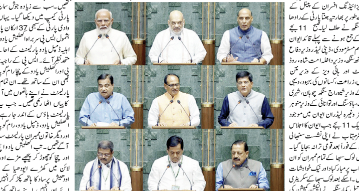
وزیر اعظم نریندر مودی نے آج یہاں سے پارلیمنٹ ہاؤس میں 18 ویں لوک سبھا کے رکن کے طور پر حلف لیا۔ وزیر اعظم نریندر مودی نے اپنے حلف میں اللہ کے نام پر حلف لیا۔

نی دہلی، 24 جون۔ (انجینئر) وزیر اعظم نریندر مودی نے آج یہاں سے پارلیمنٹ ہاؤس میں 18 ویں لوک سبھا کے رکن کے طور پر حلف لیا۔ وزیر اعظم نریندر مودی نے اپنے حلف میں اللہ کے نام پر حلف لیا۔