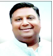
دہلی کے وزیر برائے آبی وسائل عمران حسین

وزیر خوراک و رسد عمران حسین کی وزیر برائے آبی وسائل کی ہتھکنی کنڈبیراج میں شرکت ہوئی۔