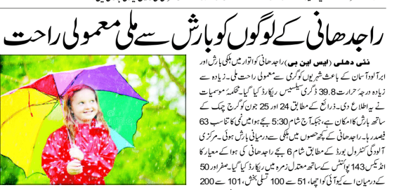
راجدھانی کے لوگوں کو بارش سے ملنے معمولی راحت

راجدھانی کے لوگوں کو بارش سے ملنے معمولی راحت۔ راجدھانی کے لوگوں کو بارش سے ملنے معمولی راحت۔