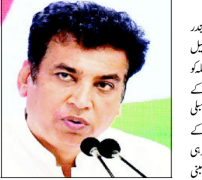
ہریانہ کے وزیر برائے آبی وسائل آتش

بی جے پی اور اے ایس آئی کے لوگوں کے جذبات سے کھیل رہی ہیں۔ بی جے پی اور اے ایس آئی کے لوگوں کے جذبات سے کھیل رہی ہیں۔ بی جے پی اور اے ایس آئی کے لوگوں کے جذبات سے کھیل رہی ہیں۔