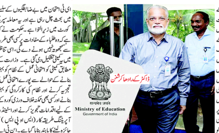
وزارت تعلیم کے وزیر اعلیٰ انانت سنگھ اور دیگر اہلکاروں کی فوٹو

ای ٹی ایم نے اعلیٰ سطحی کمیٹی کے رکنوں کی فہرست پیش کر کے کہا کہ یہ کمیٹی 2 مہینے کے اندر اپنی رپورٹ پیش کرے گی۔