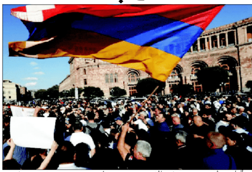
اسرائیل کی وزارت خارجہ نے آرمینیا کے تسلیم کرنے کا اعلان کیا ہے۔ اس کے بعد اسرائیل نے احتجاج کیا ہے۔