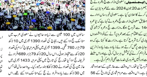
سعودی عرب میں 56 برس کے دوران 100 ملین سے زیادہ عازمین نے فریضہ حج ادا کیا۔