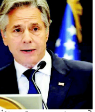
امریکی وزیر خارجہ نے اسرائیلی حکام کے ساتھ غزہ اور لبنان کے معاملات پر تبادلہ خیال کیا۔