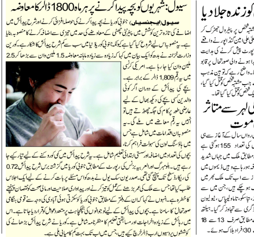
سیول: شہریوں کو بچھڑا کر پید کرنے پر ہر ماہ 1800 کا معاوضہ۔