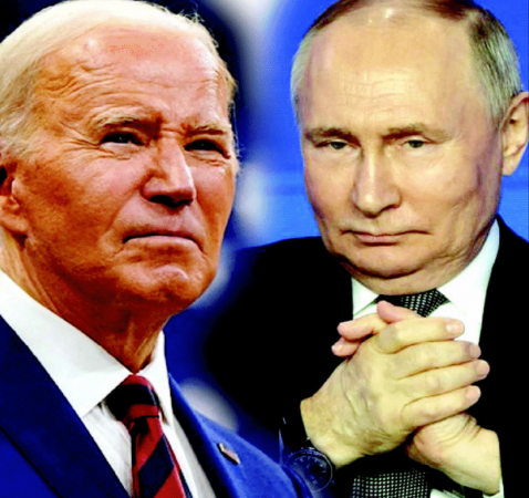
جو بائیڈن اور ولادیمیر پوٹن کی تصاویر۔

اجلاس کے دوران امریکہ نے جی-7 کے دیگر ممالک کو یوکرین کی مدد کے بارے میں بات چیت کی۔ امریکہ نے جی-7 کے دیگر ممالک کو یوکرین کی مدد کے بارے میں بات چیت کی۔ امریکہ نے جی-7 کے دیگر ممالک کو یوکرین کی مدد کے بارے میں بات چیت کی۔