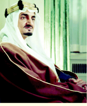
کے ساتھ شاہ فیصل کی تصویریں ہیں۔ شاہ فیصل کی موت کے بعد شاہ عبدالعزیز آل سعود نے شاہ فیصل کی جگہ پر شاہ خالد بن عبدالعزیز کو تختہ نشین کیا۔

پوری مسلم دنیا کے پاس کوئی شاہ فیصل نہیں۔ اسی لیے مسلم لیڈران دنیا کے بدلے ہوئے حالات سے فائدہ اٹھانے اور طاقت کا اظہار کرنے کی یوزیشن میں مگر جب جب جی-7 کا ذکر چھڑے گا، یہ ذکر شاہ فیصل کی جرأت مندی کے تذکرے کے بغیر ادھورا رہے گا۔