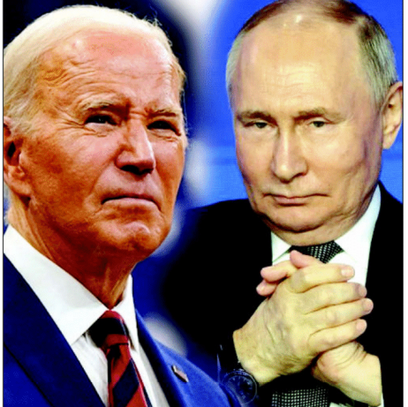
جی-7 کے سربراہ اور روس کے صدر ولادیمیر پوتن کی تصویر