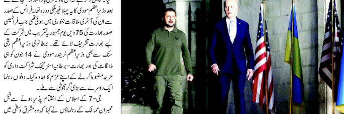
جی-7 کے سربراہ اور فرانس کے صدر ایمانوئل میکرون کی تصویر