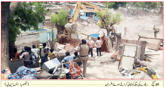
شکلا گنج، (ایس این بی) جہاز ترقی کے ریلوے کے زمین پر آباد کنبے کے مکانوں کو بلڈوزر سے گرا دیا گیا۔ اس منظر کو دیکھ کر سیکڑوں لوگ آہو باتہ ہونے لگے۔ ان کے مکانوں کو سامان بوز کر دوسرے جگہ منتقل کر کے گئے۔ گاہکوں کو ایجنسی نے زمین اہل مسرما سیکڑوں کے قتل کرنا چاہی ہے۔ تعمیری کام کے سیکڑوں کے زمین پر آباد کنبے کو بھی زمین کو اسی طرح کے زمینوں کو چھینا گیا۔ زمین کو ہٹا کر نئے مکان بنائے گئے۔

آر پی ایف کی موجودگی میں سیکڑوں کنبے سامان کرہستی سے ہونے بے دخل