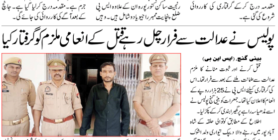
بغداد، پولیس نے عدالت سے سزا چاہی کہ قتل کے انعامی ملزم کو گرفتار کیا

پولیس نے عدالت سے سزا چاہی کہ قتل کے انعامی ملزم کو گرفتار کیا