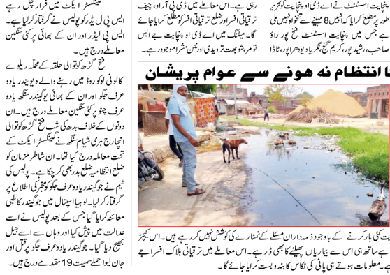
پانی کی نکاسی کا انتظام نہ ہونے سے عوام پریشان

پانی کی نکاسی کا انتظام نہ ہونے سے عوام پریشان۔ پانی کی نکاسی کا انتظام نہ ہونے سے عوام پریشان۔ پانی کی نکاسی کا انتظام نہ ہونے سے عوام پریشان۔