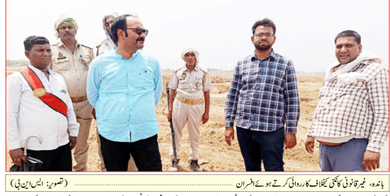
بغداد، غیر قانونی کان کنی کا خلاف کارروائی کرنے کے لیے تھانہ افسران

23 نامزد اور 15 نامعلوم افراد پر مقدمہ درج