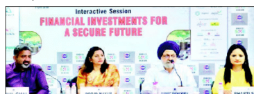
بھارتی سود کے تحت مالی سرمایہ کاری سیشن...

اپنے مالی مستقبل کو محفوظ بنانے کے لیے سمجھداری سے سرمایہ کاری کریں: بھارتی سود۔ بھارتی سود نے کہا کہ لوگوں کو اپنے مالی مستقبل کو محفوظ بنانے کے لیے سمجھداری سے سرمایہ کاری کرنا چاہیے۔ بھارتی سود نے کہا کہ لوگوں کو اپنے مالی مستقبل کو محفوظ بنانے کے لیے سمجھداری سے سرمایہ کاری کرنا چاہیے۔ بھارتی سود نے کہا کہ لوگوں کو اپنے مالی مستقبل کو محفوظ بنانے کے لیے سمجھداری سے سرمایہ کاری کرنا چاہیے۔ بھارتی سود نے کہا کہ لوگوں کو اپنے مالی مستقبل کو محفوظ بنانے کے لیے سمجھداری سے سرمایہ کاری کرنا چاہیے۔