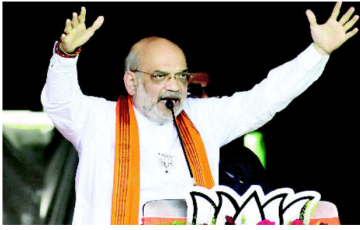
پاکستان کے ایٹمی بم سے ڈرنے والے نہیں ہیں۔ امت شاہ نے ایک پروگرام میں کہا ہے۔

آرا (یو این آئی) مرکزی وزیر داخلہ امت شاہ نے جمعہ کو ایک بار پھر دہلی میں پاکستان کے ایٹمی بم سے ڈرنے والے نہیں ہیں، پاکستان کے وزیر چند شہر (پٹی او کے) ہمارے اور ہم سے لے کر رہیں گے، یہ بی بی سی کے ایک پروگرام میں کہا ہے۔ امت شاہ نے ایک پروگرام میں کہا ہے کہ پاکستان کے ایٹمی بم سے ڈرنے والے نہیں ہیں۔ پاکستان کے ایٹمی بم سے ڈرنے والے نہیں ہیں۔ پاکستان کے ایٹمی بم سے ڈرنے والے نہیں ہیں۔