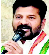
Caption of the man speaking in the Lok Sabha election article.

لوک سبھا انتخابات حکمرانی پر ریفرنڈم: ریونٹ ریڈی