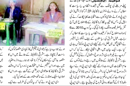
پولنگ کے موقع پر ای این پی او کے اہلکاروں نے پولنگ کے بائیکاٹ کا اعلان کیا۔

صرف فیصد ووٹنگ - علیحدہ انتظامیہ یا علیحدہ ریاست کا مطالبہ - چیف الیکٹورل آفیسر نے ای این پی او کو جاری کیا جو ہمتا ونوٹس