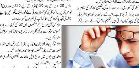
آنکھوں میں دھندلا پن محسوس ہونے پر فوری طور پر طبی مشورہ لینا چاہیے۔