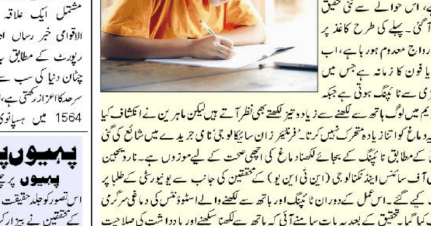
ہاتھ سے لکھنا دماغ کے لیے کتنا فائدہ مند ہوتا ہے۔