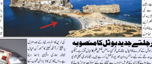
دنیا کی مختصر ترین سرحد کا اعزاز رکھتی ہے۔