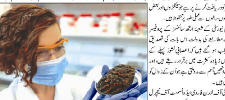
دماغ ہمارے جسم میں سب سے زیادہ پیچیدگی والا اور سب سے زیادہ محفوظ ہے۔