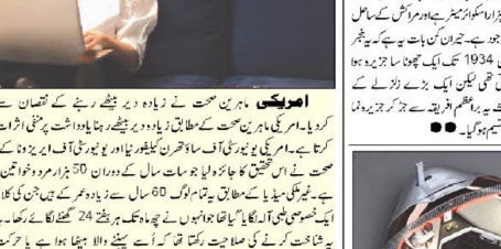
زیادہ دیر بیٹھے رہنے کے خطرناک نتائج سامنے آئے ہیں۔