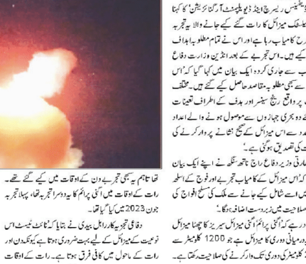
بھارتی فوج نے ایک نائٹ ٹرائل میزائل کی تجرباتی طور پر جانچ کی۔

دہلی کے مطابق ایک گاڑی 11 ہزار کلوگرام اگنی پرائم گم کا نائٹ ٹرائل کی صلاحیتوں کے ساتھ ساتھ ایک میزائل کے طور پر بھی استعمال کیا جاسکتا ہے۔