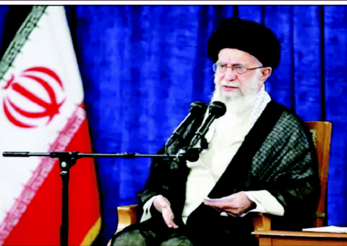
ایران کے اسرائیل کو اس فضا کی خطا کا ذمہ دار سمجھا گیا ہے۔

ایران کے اسرائیل کو اس فضا کی خطا کا ذمہ دار سمجھا گیا ہے۔ اسرائیل نے اس خطا کو کھینچ لیا ہے۔ اسرائیل نے اس خطا کو کھینچ لیا ہے۔ اسرائیل نے اس خطا کو کھینچ لیا ہے۔ اسرائیل نے اس خطا کو کھینچ لیا ہے۔ اسرائیل نے اس خطا کو کھینچ لیا ہے۔