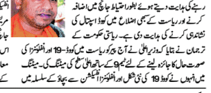
یوپی کے سبھی اضلاع میں کووڈ اسپتال کی نشاندہی کی جائے: یوگی۔

یوپی کے سبھی اضلاع میں کووڈ اسپتال کی نشاندہی کی جائے: یوگی۔ یوپی کے سبھی اضلاع میں کووڈ اسپتال کی نشاندہی کی جائے: یوگی۔