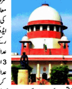
سیکشن 3 اور 4 کے تحت جج کمیٹی آف انڈیا تشکیل دی جائے: سپریم کورٹ۔

سیکشن 3 اور 4 کے تحت جج کمیٹی آف انڈیا تشکیل دی جائے: سپریم کورٹ۔ سیکشن 3 اور 4 کے تحت جج کمیٹی آف انڈیا تشکیل دی جائے: سپریم کورٹ۔