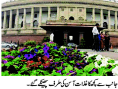
اڈانی معاملے پر بے پی سی کی مانگ، پارلیمنٹ کی کارروائی دن بھر کیلئے ملتوی۔

اڈانی معاملے پر بے پی سی کی مانگ، پارلیمنٹ کی کارروائی دن بھر کیلئے ملتوی۔ اڈانی معاملے پر بے پی سی کی مانگ، پارلیمنٹ کی کارروائی دن بھر کیلئے ملتوی۔