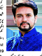
نقصی (جمہوریہ) سرکار نے آج پریس فریڈم انڈیکس میں ناقصی کا اعلان کیا ہے۔

ڈولڈ پریس فریڈم انڈیکس، کورس کارنیز میں ناقصی: انور اگ ٹھاکر۔ ڈولڈ پریس فریڈم انڈیکس، کورس کارنیز میں ناقصی: انور اگ ٹھاکر۔