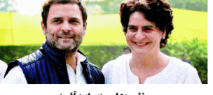
اڈانی گروپ میں سرکاری سرمایہ کاری کی تحقیقات کیوں نہیں کرانی جاتی: راہل-پریس کا۔

اڈانی گروپ میں سرکاری سرمایہ کاری کی تحقیقات کیوں نہیں کرانی جاتی: راہل-پریس کا۔ اڈانی گروپ میں سرکاری سرمایہ کاری کی تحقیقات کیوں نہیں کرانی جاتی: راہل-پریس کا۔