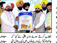
جانن ہر کے لوگوں کو 100 کروڑ روپے کے ترقیاتی پروجیکٹوں کا تحفہ۔

جانن ہر کے لوگوں کو 100 کروڑ روپے کے ترقیاتی پروجیکٹوں کا تحفہ۔ جانن ہر کے لوگوں کو 100 کروڑ روپے کے ترقیاتی پروجیکٹوں کا تحفہ۔